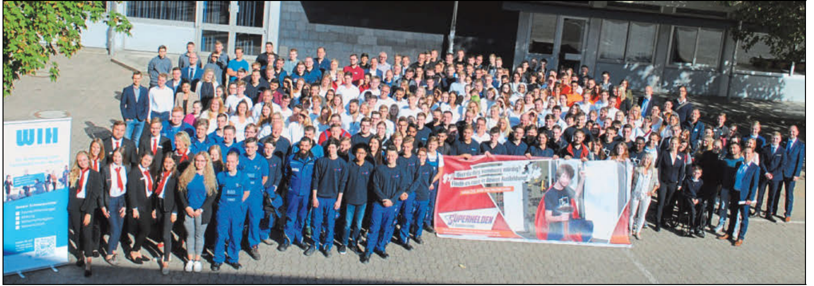
»Sie sind unsere Zukunft«: Mit diesem motivierenden Gefühl starten die 250 Auszubildenden durch.